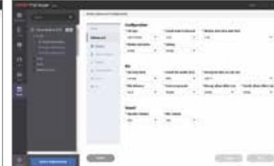
solución óptima para control de accesos